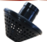
Strainer หัวกรองน้ำ