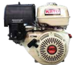
SG series Air Cooled 4-Cycle Gasoline