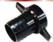
Coupling set ข้อต่อสวมสาย