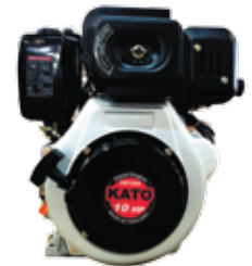
SM series Air Cooled 4-Cycle Diesel