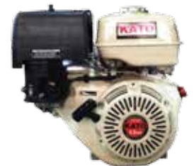
Air Cooled 4-Cycle Gasoline