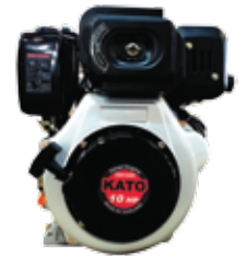
Air Cooled 4-Cycle Diesel